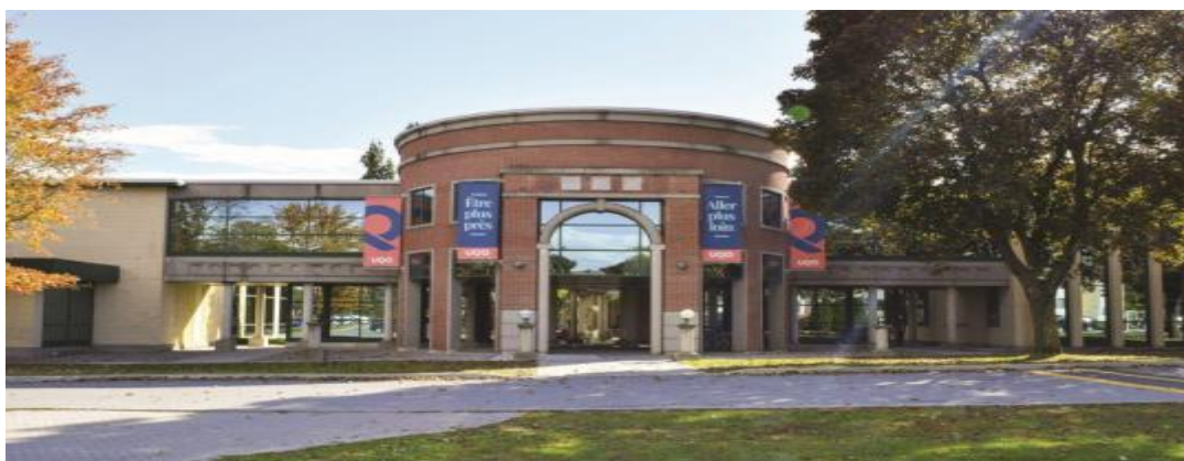
Campus de Gatineau.

Le Département des sciences comptables de l'Université du Québec en Outaouais cherche actuellement à pourvoir un poste de professeur.e dans le domaine de la certification à son campus de Gatineau.